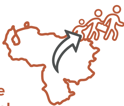
Figura 1. Matrícula en educación ordinaria según nacionalidad

En términos generales, la población migrante venezolana ha generado una presión adicional sobre la demanda escolar en el sistema público de educación , lo que se refleja en el número de estudiantes, que se triplicó entre en el período lectivo 2018-2019 y el 2019-2020. Como se aprecia en el Gráfico 2, esta presión puede cuantificarse en términos económicos, si se considera que el costo referencial por estudiante extranjero es de 857 dólares por año lectivo.